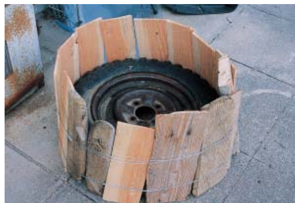
やった！私たちの班のシンボルができたよ。