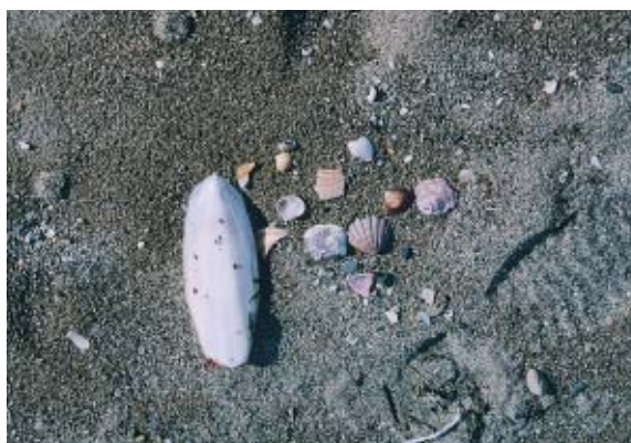
魚やイカなどの骨が

冬から春にかけて、砂浜にはたくさんの漂流物が打ち上げられています。 どのようなものが打ち上げられているのでしょうか？