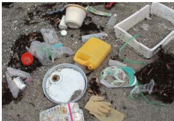
いろいろなゴミが！