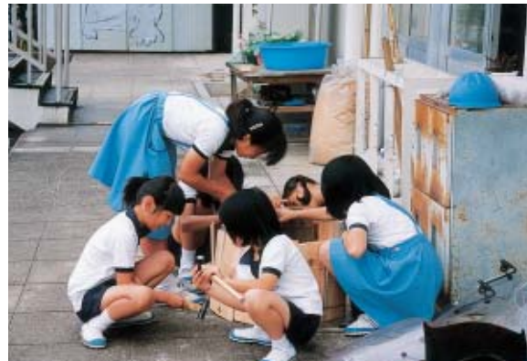
さあ、みんなで力を合わせてがんばろう！