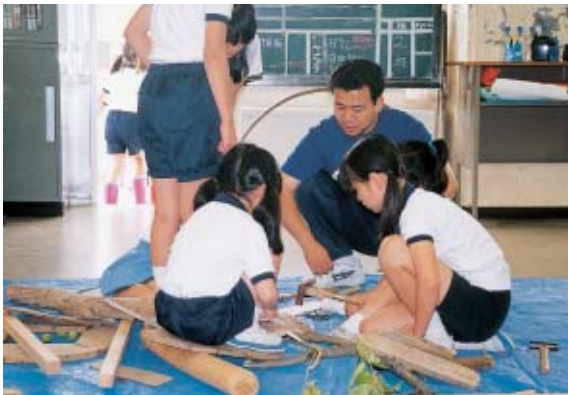
自分たちのオブジェにあう材料はどれかな？

あつめた流木を使って、木工用ボンドで接着したり、くぎで打ちつけたり、ペイントマーカーで彩色したりしてオブジェ作りを楽しみましょう。どんな楽しい作品ができるかな。さあ、やってみよう！