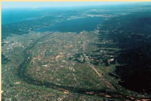
出雲平野を流れる斐伊川

川では昔から、大雨のたびに洪水がくり返されてきました。その時に、たくさんの土砂が流され、下流部に積もっていきました。川は大雨の時に、大地を変化させる力が大きくなるのです。