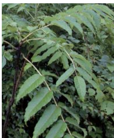
カラスザンショウ