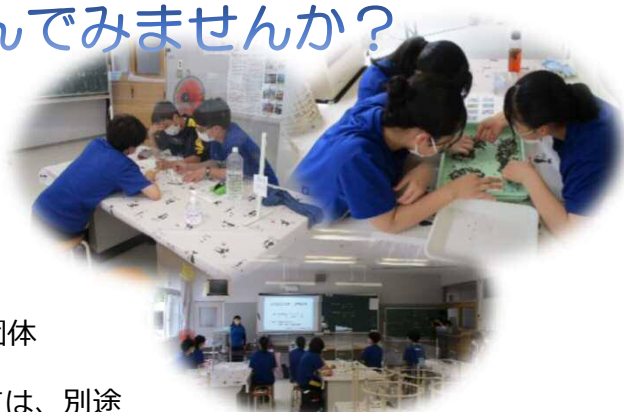
過去に実施した出前講座の様子