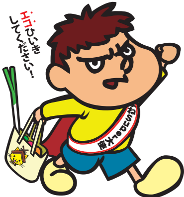
しまねSuper大使 吉田くん

島根県では、省エネ・省資源の視点で店舗やサービスを選択するなど、消費者が環境にやさしい店舗を積極的に利用する社会をつくるため、新たに「しまエコショップ登録制度」を創設します。