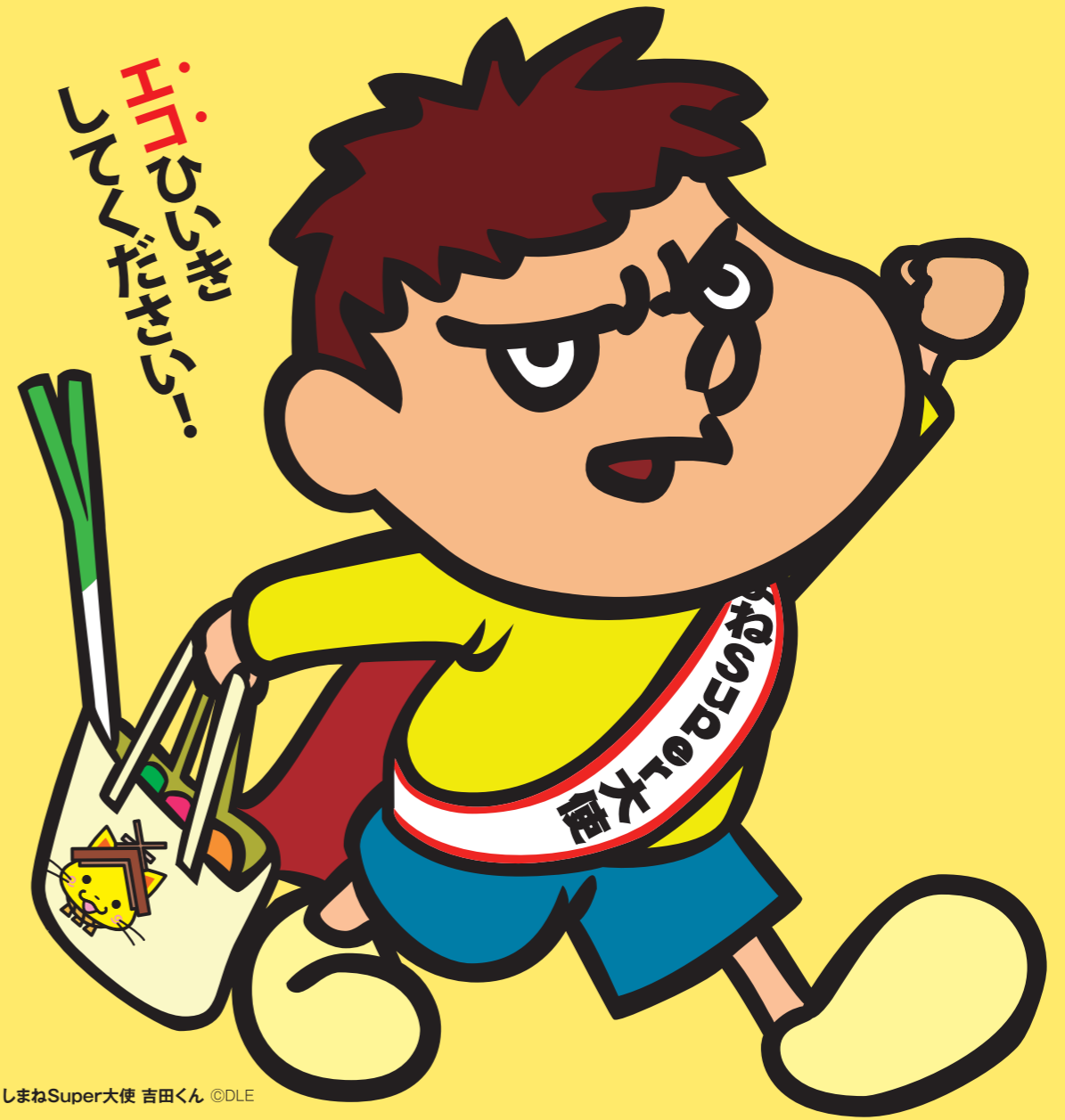
しまねSuper大使 吉田くん ©DLE

島根県環境政策課 〒690-8501 島根県松江市殿町1番地 TEL:0852-22-6237 FAX:0852-25-3830