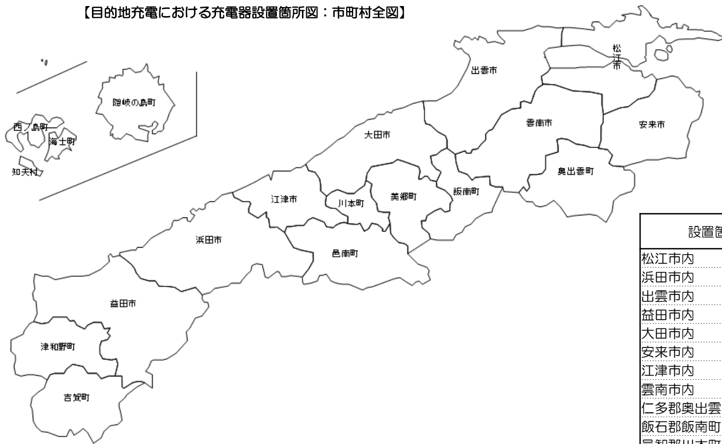
【目的地充電における充電器設置箇所図：市町村全図】