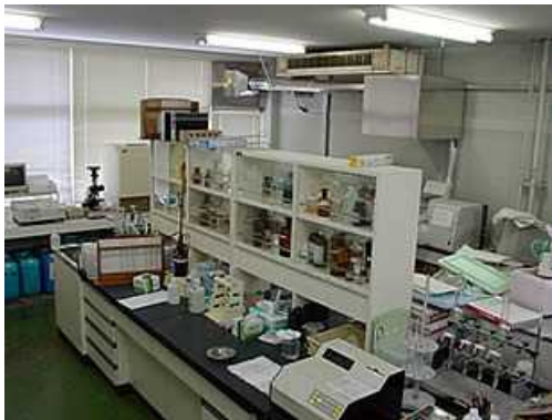
企業局東部事務所水質検査室

また、水質管理目標設定項目、クリプトスポリジウム及びジアルジア検査については前記検査機関への委託検査により実施します。