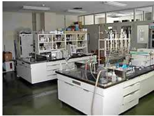
企業局西部事務所水質検査室