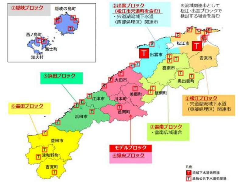
図2 広域化・共同化ブロック割

平成30年度に県と各市町村の担当者による勉強会を行い、令和元年度からは図2に示すブロックごとの検討会を計5回にわたり行った上で、取組の内容を整理し、「島根県汚水処理事業広域化・共同化計画」として取りまとめた。