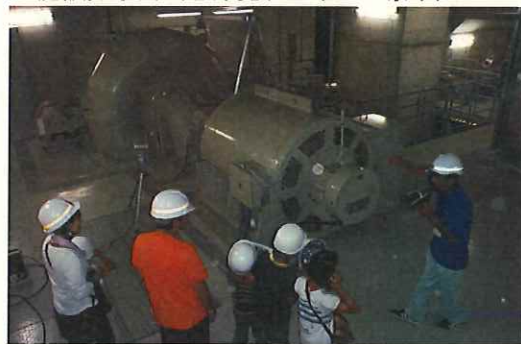
○施設見学会(志津見ダムポピー祭り)