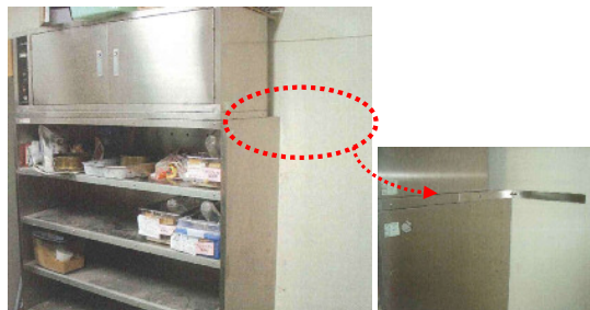
身の周りの家具の耐震化手法について、写真を使って説明し、安全に対する意識を高めるきっかけにもなります。

【わが街・わが家の防災対策】では、主に自宅や地域ですぐにできる地震対策の方法や、地震に対する心構えについて、お話しします。