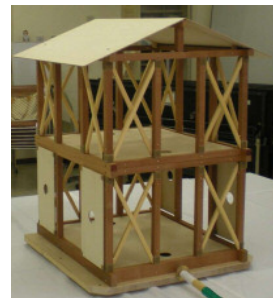
実際に住宅モデルを揺らしてみ、強くするにはどうしたら良いかを実験することができます。

【わが街・わが家の防災対策】では、主に自宅や地域ですぐにできる地震対策の方法や、地震に対する心構えについて、お話しします。