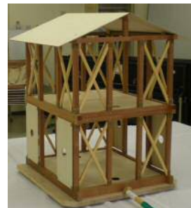
実際に住宅モデルを揺らしてみても、強くするにはどうしたら良いかを実験することができます。

【わが街・わが家の防災対策】では、主に自宅や地域ですぐにできる地震対策の方法や、地震に対する心構えについて、お話しします。