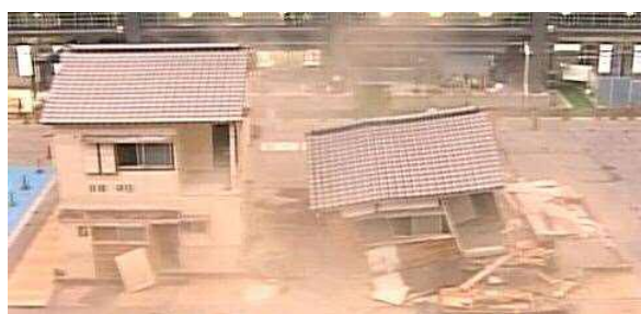
無補強と補強済みの住宅を比較する動画を観ながら、地震に備えることの大切さをお伝えします。

【わが家の耐震診断してみませんか？】では、主に木造住宅の簡易な耐震診断の方法についてや、補強のしかたについて、わかりやすく説明します。