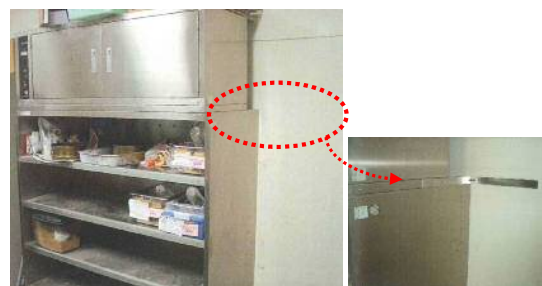
身の回りの家具の耐震化手法について、写真を使って説明し、安全に対する意識を高めるきっかけにもなります。

【わが街・わが家の防災対策】では、主に自宅や地域ですぐにできる地震対策の方法や、地震に対する心構えについて、お話しします。