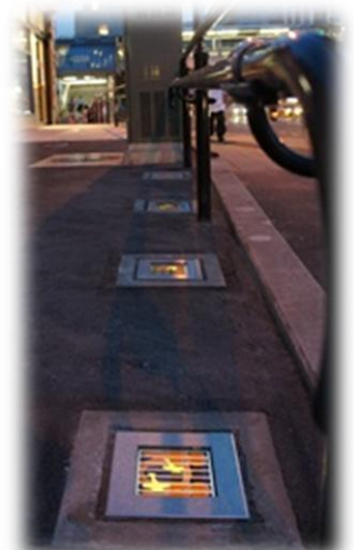
店舗入口の「AKARIE」が優しい光で出迎える。 (横浜市内)