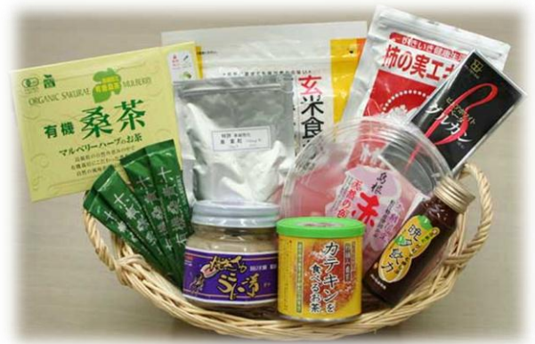
桑、柿などの商品化品目（一部）

さらに県内企業の商品開発、販路拡大、栽培、加工技術の向上に向けた取り組みを様々な角度から支援し、機能性食品産業群の育成を行った。