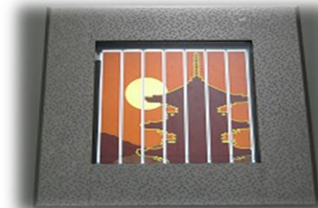
DSC製品「AKARIE」 シースルーの電池で日中に発電し、夜間に内蔵のLEDが電池表面の絵柄を照らし出す。

材料が安価であること、製造工程が簡便であること、意匠性(フィルム化、多色化)に富んでいることなどが特長。