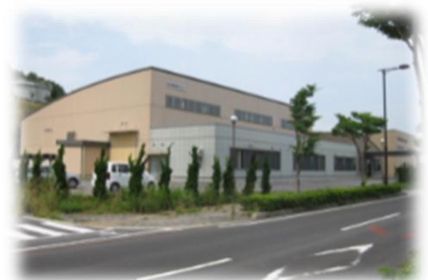
日立ツール(株)立地 （複合コーティング）