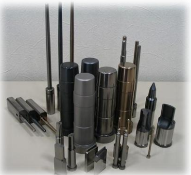
プラズマ熱処理適用事例 「Tribec」シリーズ

機械金属材料にプラズマ状態（電子が分子から離れ自由に動き回る状態）を利用して炭素や窒素を浸入させ、その材料の表面の強度や長寿命化を図るなど、プラズマ技術による工業製品の高機能化・高付加価値化を図った。