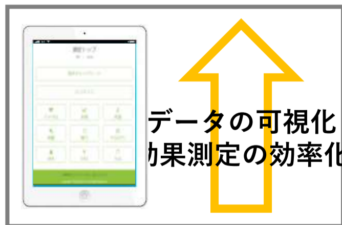
【ICT健康管理システム】