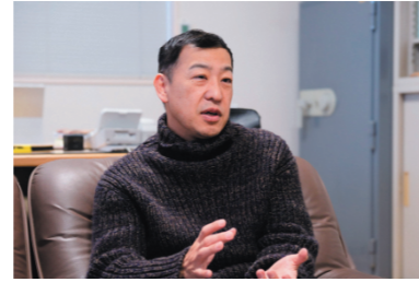
トップインタビューの様子

特設ポータルサイトを活用し、県内企業の製品・サービスや取組を、グリーンビジネスに関心がある企業や川下企業等に向けて幅広くPRします。