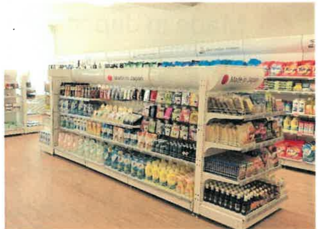
上記写真の場所にて販売実施します。（ウラジオストク中央郵便局）

※品目によっては、ロシアポストで販売が出来ない場合がございます。また、複数の商品を希望される場合は別途相談をさせていただきます。予めご了承ください。