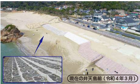
現在の弁天島前(令和4年3月)

第1工区の護岸ブロックの据付が完了しました。弁天島前の護岸は景観を考え、ブロック表面に鉄平石を貼り付けています。今後、令和4年度に駐車場側の植栽工を行い、飛砂防止対策を実施して行きます。