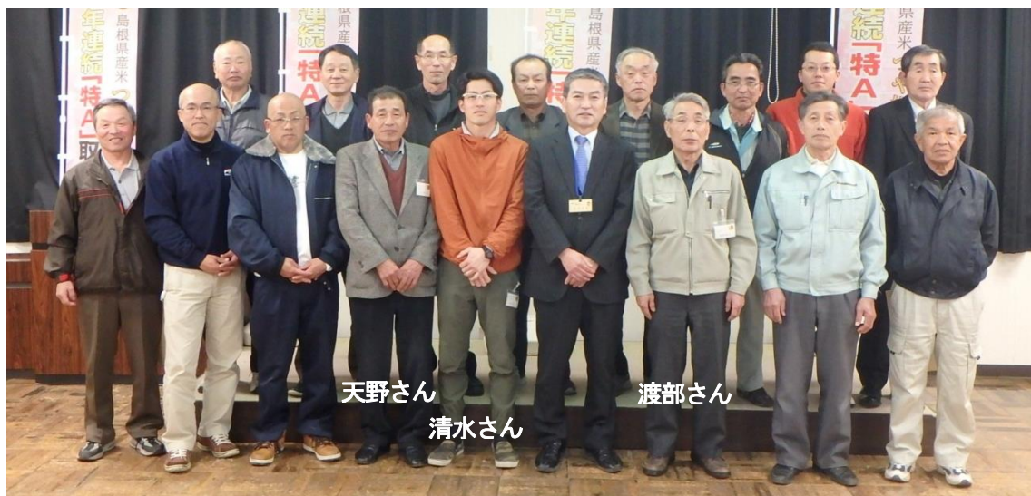
島根の「つや姫」マイスターの皆さん

平成28年産の「つや姫」作付面積は約1,000haが見込まれており、今後ますますマイスターの皆さんの活躍が期待されます。