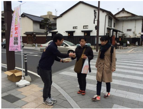
出雲大社 神門広場前にて