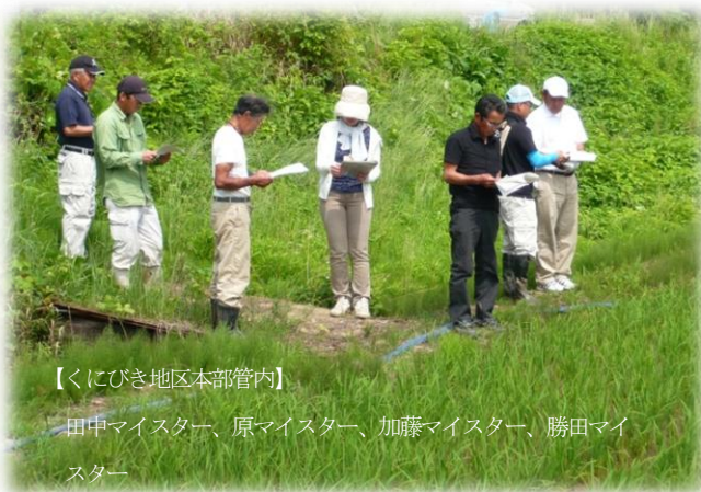
【くにびき地区本部管内】

また、この日の午後は、一般のつや姫生産者を対象とした栽培講習会がマイスター圃場を活用して開催されました。