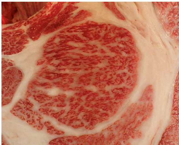
去勢、ロース芯面積 77cm 2 、BMSNo.12 正之助-茂洋-第6栄

参考: 茂弘松井 (去勢) (495.2) (70.0) (8.3) (2.6) (75.5) (8.3) (75%)