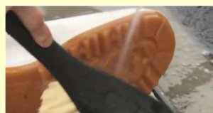
Lakukan disinfeksi setelah membersihkan semua kotoran yang menempel.