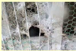
Kawat jaring kandang ayam yang rusak