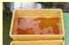
Mengganti cairan disinfektan.

Lakukan pengawasan ketat terhadap kondisi kesehatan hewan ternak setiap harinya. Apabila menemukan kejanggalaan, segera hubungi Pusat Kesehatan Peternakan terdekat.