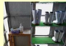
Tempat sepatu bot