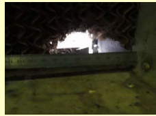
Lubang di tembok kandang ayam