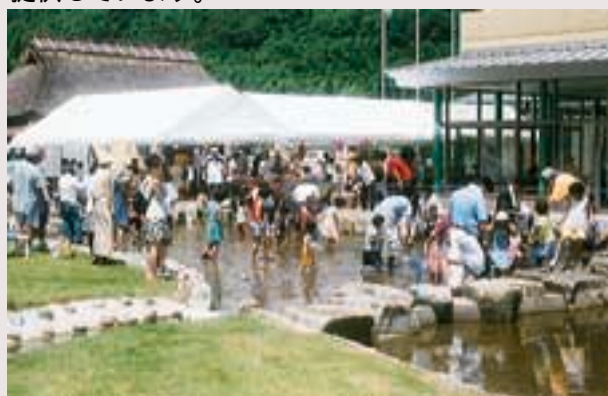
イベント会場として利用