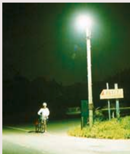
防災安全：街路灯の整備

農村総合整備事業では、この総合施設の用地整備、駐車場、修景施設の整備を受け持ち、地域住民や訪れた都市住民がくつろげるよう整備を行いました。