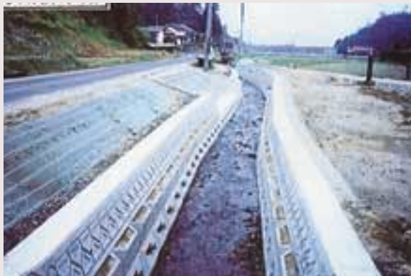
ホタルの棲息を考慮した用排水路