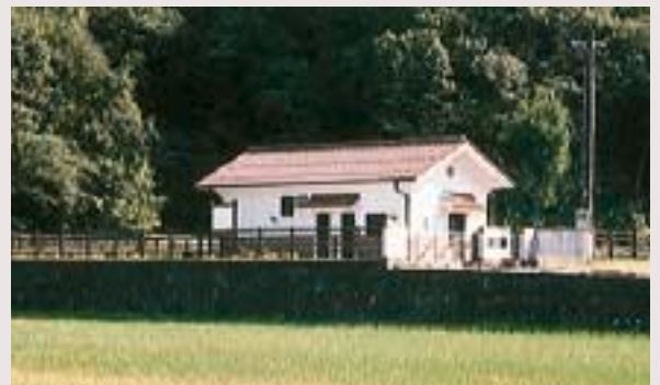
農業集落排水処理場(鏡地区)

集落周辺の水路は、水田への用水や排水だけでなく生活雑排水を受けるものも多い。蚊やハエの発生を防止し、快適な環境づくりを行います。また、町内で別途進めている農業集落排水事業も水質保全に寄与しています。