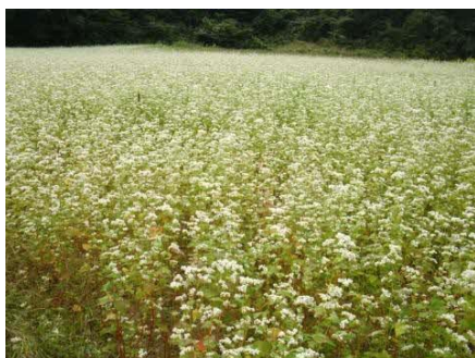
【横田地区・作付状況（写真 左：そば、右：醸造用ぶどう）】