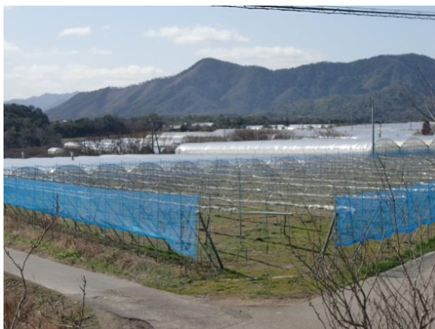
【 益田地区・営農状況（写真 左：ぶどう、右：ケール）】