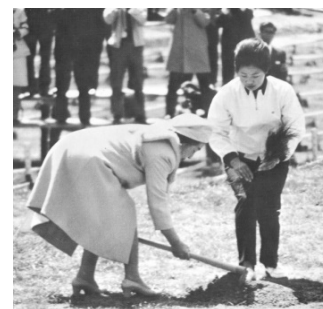
両陛下によるお手植え(クロマツ)