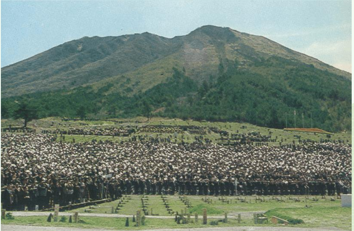
第 22 回全国植樹祭会場（大田市三瓶山北の原）