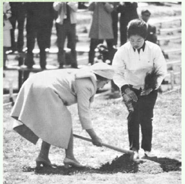
皇后陛下お手植えの様子