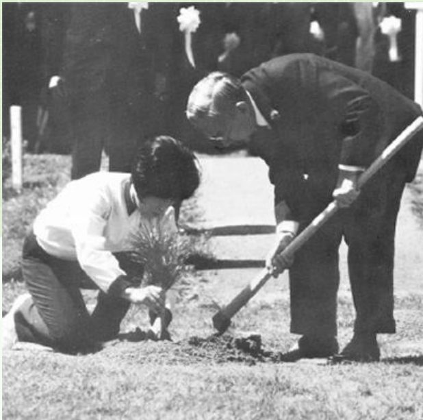
天皇陛下お手植えの様子