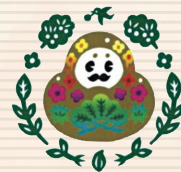
第66回大会【石川県】 愛称: ひやくまんさん