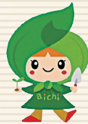
第70回大会【愛知県】 愛称: 森ずきんちゃん