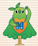
第64回大会【鳥取県】 愛称: トッキーノ