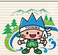
第68回大会【富山県】 愛称: きときと君