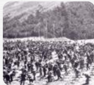
(昭和46年の第22回大会の様子)