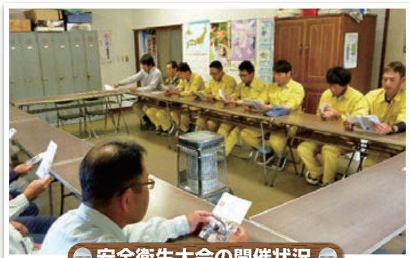
安全衛生大会の開催状況