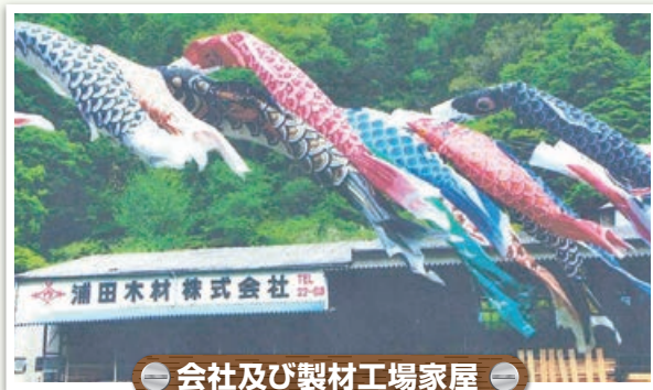
会社及び製材工場家屋