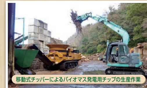
移動式チッパーによるバイオマス発電用チップの生産作業