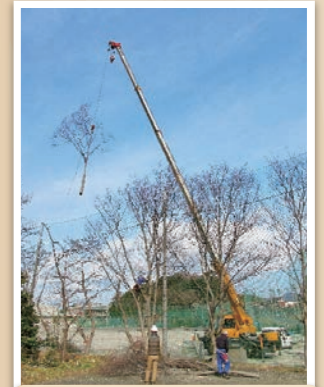
吊り伐りによる支障木の特殊伐採作業