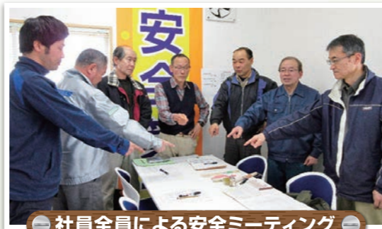
社員全員による安全ミーティング

弊社は出雲平野の南側に広がる山間地の入口付近に位置し、会社から約15km圏内の森林地帯を中心に事業展開しています。また、従業員の増に備えて会議スペースを広くしました。