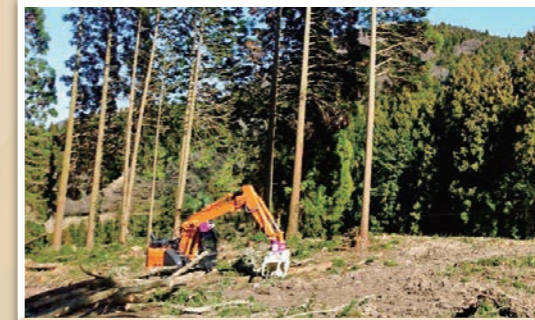
出雲市朝山町の伐採現場で活躍中の「フェラーバンチャザウルスロボ」

また、森林の資源育成や景観維持にも配慮し、森林所有者の方々に再造林を促すため、平成29年度から森林組合と「伐採と再造林の連携協定」を締結し、森林の再生にも努力しています。