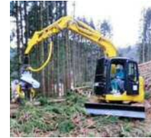
伐採・枝払い作業中