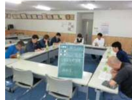
労働安全衛生委員会