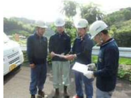
作業前ミーティング