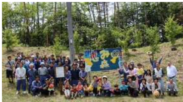
企業CSR活動による森づくり