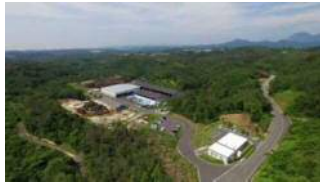
本社及びバイオマス加工施設

本社の位置する美郷町は、島根県のほぼ中央部に位置しています。近年はバイオマス事業にも力を入れて取り組み、貴重な資源である木材を有効活用すべく全量再生利用しています。「働くときにはしっかり働き、遊ぶときにはしっかり遊ぶ」がモットーの当社。20代から50代の作業員がいきいきと働いています。