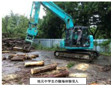
地元中学生の職場体験受入