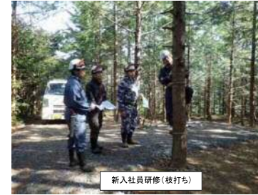
新入社員研修(枝打ち)