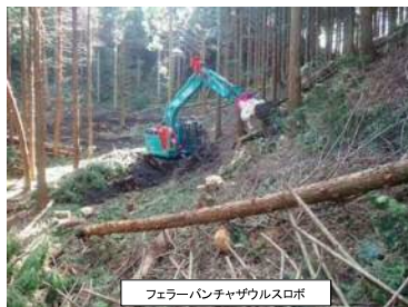
フェラーバンチャザウルスロボ