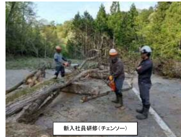
新入社員研修(チェーンソー)