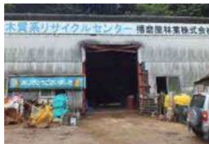
八戸リサイクルセンター