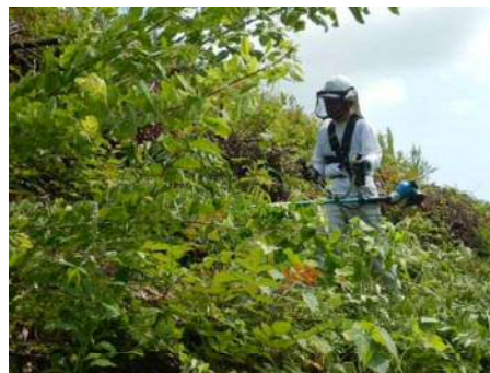
刈払機による下刈作業