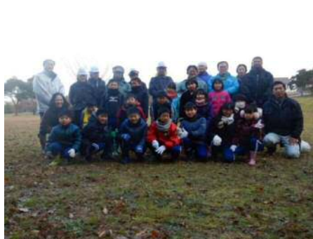
地元小学生の植樹体験活動に指導者として参加しました！！