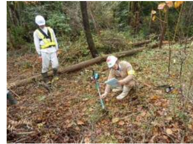
作業前の刈払い機点検