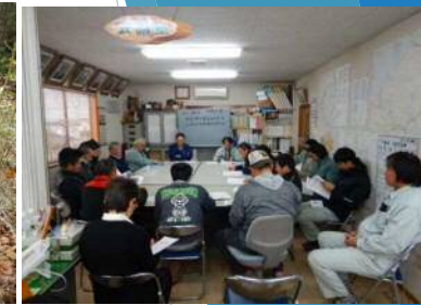
安全衛生全体研修