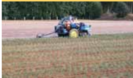
東部農林振興センター