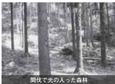
間伐で光の入った森林

公共工事に伴い排出されるCO 2 の一部を、間伐の実施（資金提供）によりオフセット。