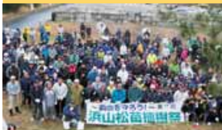
東部農林振興センター出雲事務所