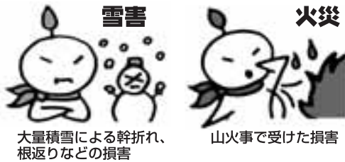
大量積雪による幹折れ、根返りなどの損害