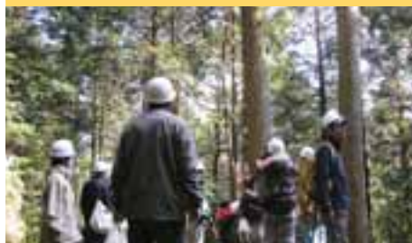
西部農林振興センター