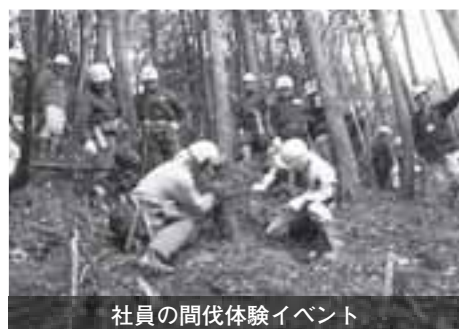
社員の間伐体験イベント