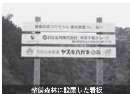
整備森林に設置した看板