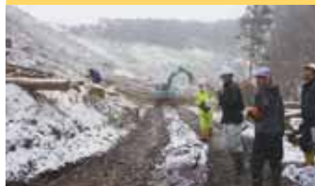
西部農林振興センター県央事務所