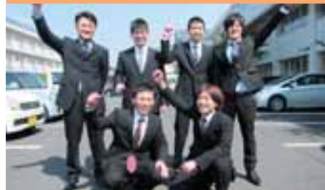
島根県立農林大学校林業科