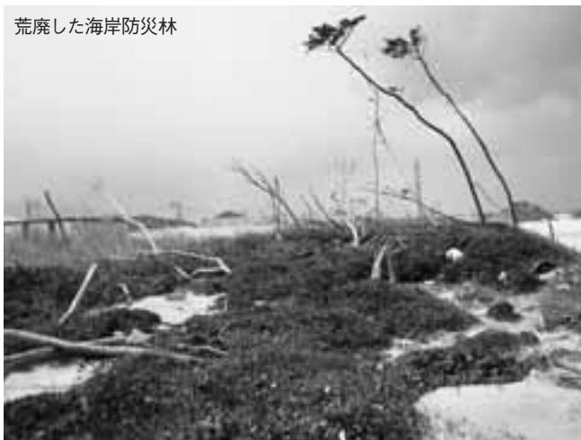
荒廃した海岸防災林

近年、松くい虫被害や気象害などを要因とした防災林の荒廃が各地で見られます。そこで、荒廃地へ自然に侵入してくる植生や治山施設の活用方法などを研究することにより、防災林の確実で効率的かつ低コストな再生方法を提案します。