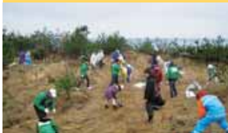
西部農林振興センター益田事務所

URL : http://blog.goo.ne.jp/f-masuda_001/