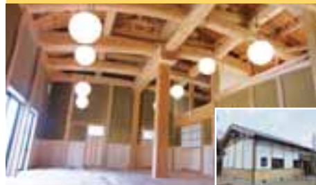
東部農林振興センター雲南事務所