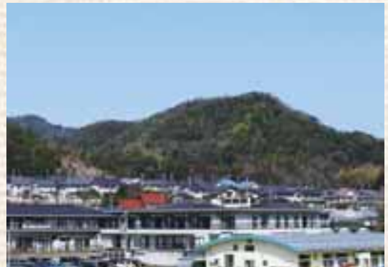
松江市法吉町から望む真山(左後方)と白鹿山

真山と白鹿山は、いにしへの武将達の夢と攻防の跡ですが、今日では市街地近郊の身近な山歩きの場となっています。 [内藤暢文]