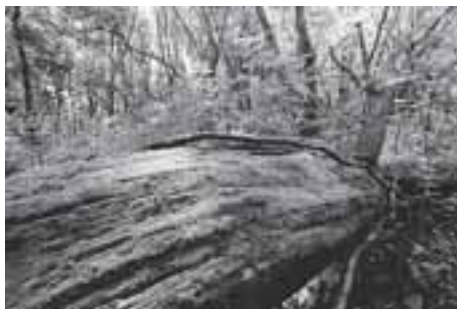
「受け継がれるいのち」(西村千代子)