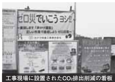
工事現場に設置されたCO 2 排出削減の看板