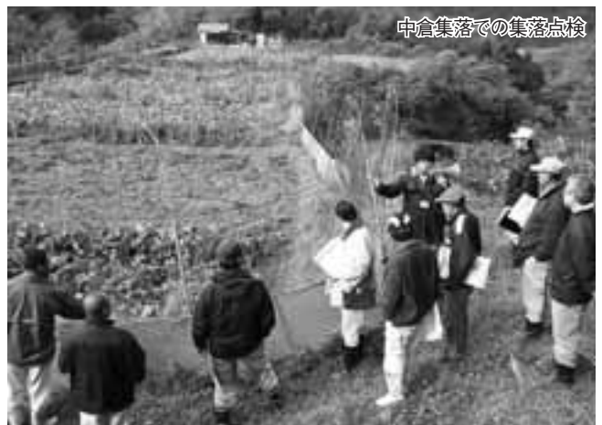
中倉集落での集落点検

川本町のモデル集落において、集落周囲の森林に緩衝帯（見通しを良くして、出没抑制を図る）を設置し、サルの誘引物となるクズ野菜や放棄果樹などを除去する「環境整備」と、群れの出没時にロケット花火などを使う徹底的な「追い払い」を行い、「集落一体となったサル対策」の効果を実証することにより、本県に適した効果的な技術手法を確立します。