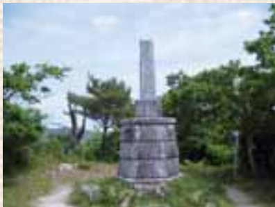
真山山頂の尼子勝久顕彰碑

立された尼子勝久は、島根半島に上陸後、真山城を奪取し、月山富田城の奪還を狙いましたが敗退、真山城は再び毛利氏の手へ渡り、夢は潰えます。