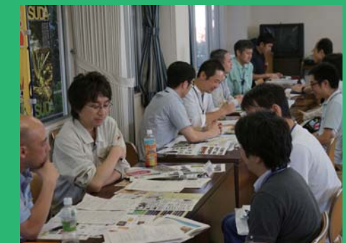
各市町村の担当者が相談を承ります。