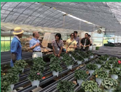
現地では施設・農場での見学・農業体験が出来ます。(各市町村により異なります。)