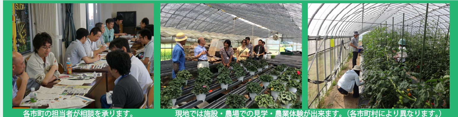
各市町の担当者が相談を承ります。 現地では施設・農場での見学・農業体験が出来ます。(各市町村により異なります。)

ツアー申込時に現地案内を希望する市町村をお選びください。 【添乗員】 同行しません。 【募集人員】 25名募集 (最小催行人員5名) 【ツアー代金に含まれるもの】 * 大阪~島根 往復バス代金 * 宿泊2泊 * 朝食2回・昼食1回 夕食1回 * 出雲大社周辺ガイド費用