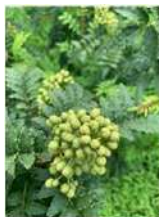
ブドウ山椒(生果と乾燥果)