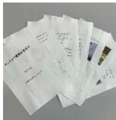
山椒栽培の手引き

山椒栽培に関する知見がほとんどないため、農業技術センターと連携して、 安定生産・省力化栽培技術を実証 することで山椒栽培の手引きを作成。