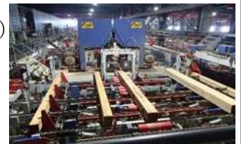
(株)オービスの製造ライン