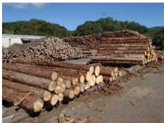
中間土場施設(亀嵩)での集材状況