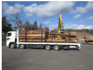
トラック積込・出荷の様子