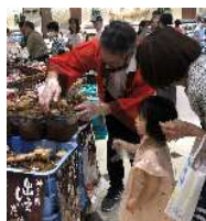
大阪 阪急百貨店 販促