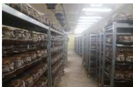
菌床しいたけ栽培施設