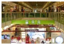
香港デパート 一田百貨店