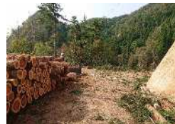
山土場で仕分けられた材