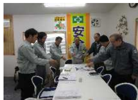
定例業務ミーティング