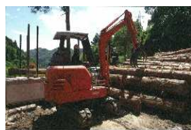
丁寧な重機の取扱