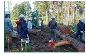
外部講師による採材研修

A材の需要と供給情報を収集し 社内で共有化していくことで、原木販売額の向上に努めていく。