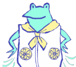
ファン付きウェア、 ネッククーラー