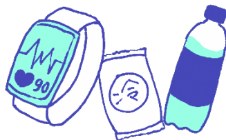
ウェアラブル端末、 応急セット