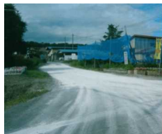
消石灰を散布し、農場進入車両のタイヤを消毒