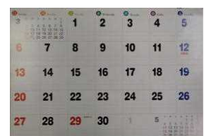
カレンダーを用いた入場者の記録

万が一、HPAIや口蹄疫を疑う症状が見られた場合は、すぐに当所へご連絡ください！