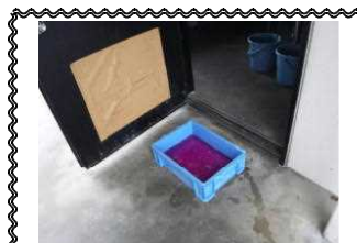
畜舎入口に消毒槽を設置し、靴底を消毒