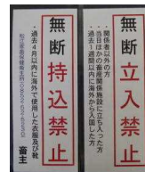
立入禁止看板の設置