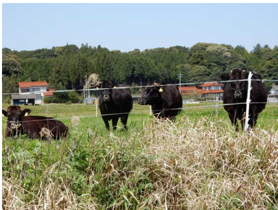
放牧されている牛（斐川町神庭1）

普及部としては、斐川町をお手本として、他地域へ放牧を啓発していきたいと考えています。