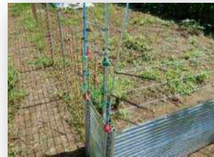
しっかりした防除が基本

申請の方法やお問合せなどは、島根県西部農林振興センター林業振興課へ TEL：0855-29-5604