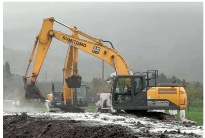
(防疫対応の様子)

養鶏生産者の衛生的努力により、本県においては無事に鳥インフルの好発時期が過ぎようとしています。一方で「豚熱」が国内屈指の畜産地帯の宮崎県で養豚場発生がみられました。ワクチン接種ではどうしても埋めきれない“免疫の穴”があり、衛生管理の隙間をつくようにウイルスは侵入してきます。また、“春の季語”口蹄疫もこの2月に韓国で発生、小康を得ておりますが油断はなりません。