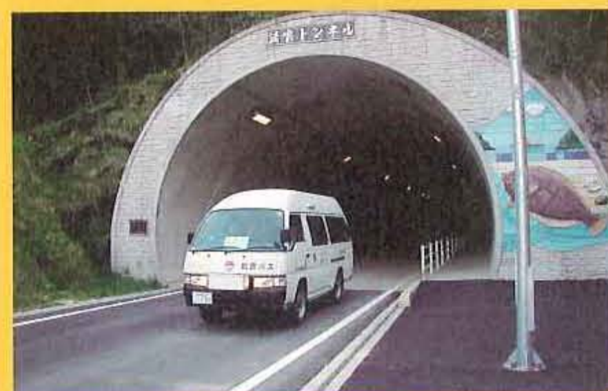
市営バスの運行（松江市 美保関線）

また、災害により国道や県道などが通行止めになった際には、迂回路としての機能を発揮することもあります。