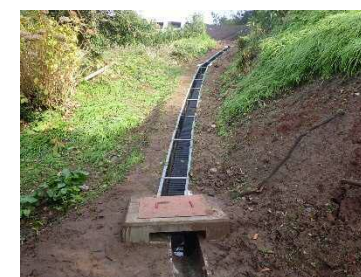
地表水排除工 (表面水の地下浸透を防ぐ：排水路)