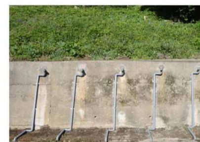
地下水排除工 (地下水の排除：水抜きボーリング)