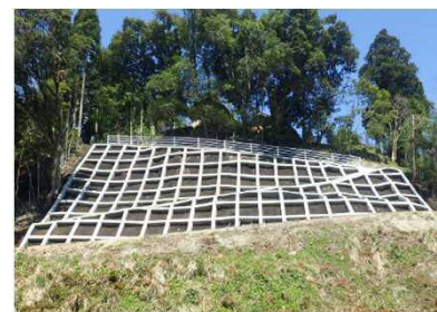
排土 + 法枠 (土砂を除去し斜面の安定を図る)