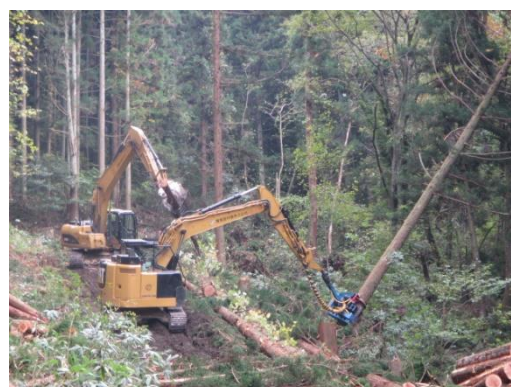
高性能林業機械による原木生産