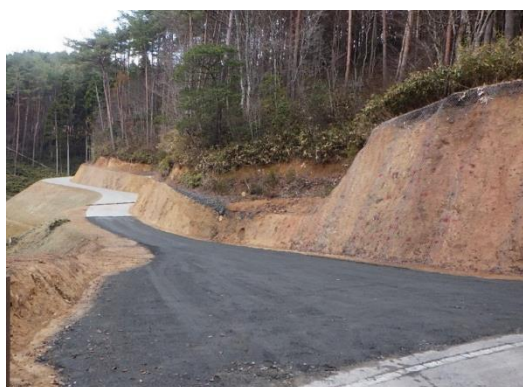
林業専用道開設状況