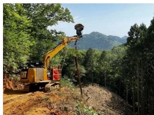
高性能林業機械による原木生産