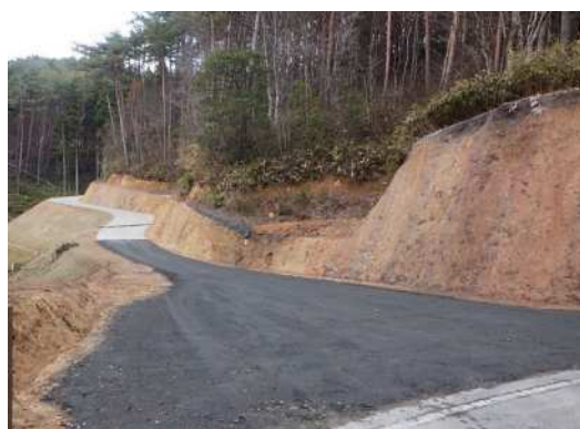
林業専用道開設状況