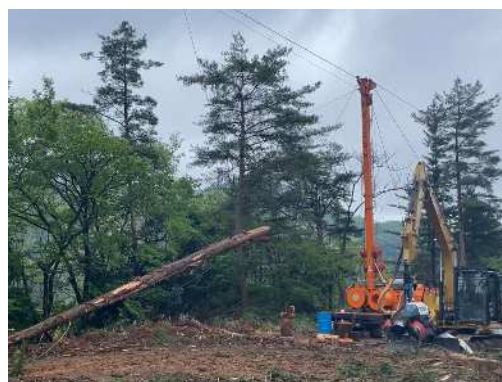
高性能林業機械による原木生産